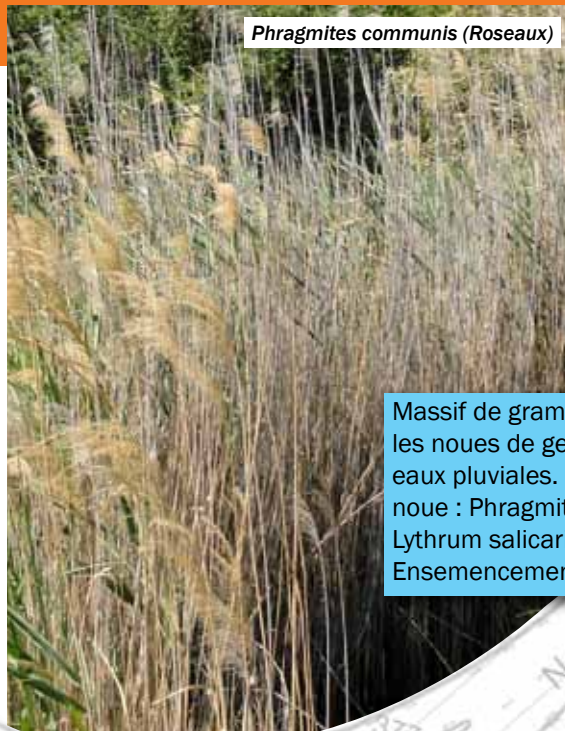
Phragmites communis (Roseaux)

Massif arbustif de 2 m large en pourtour du merlon ( Cornus sanguinea , Ligustrum vulgare , Euonymus europaeus , Viburnum lantana , Viburnum opulus , Elaeagnus x ebbingei )