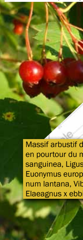
Sorbus torminalis (Sorbier)

Massif arbustif de 2 m large en pourtour du merlon ( Cornus sanguinea , Ligustrum vulgare , Euonymus europaeus , Viburnum lantana , Viburnum opulus , Elaeagnus x ebbingei )