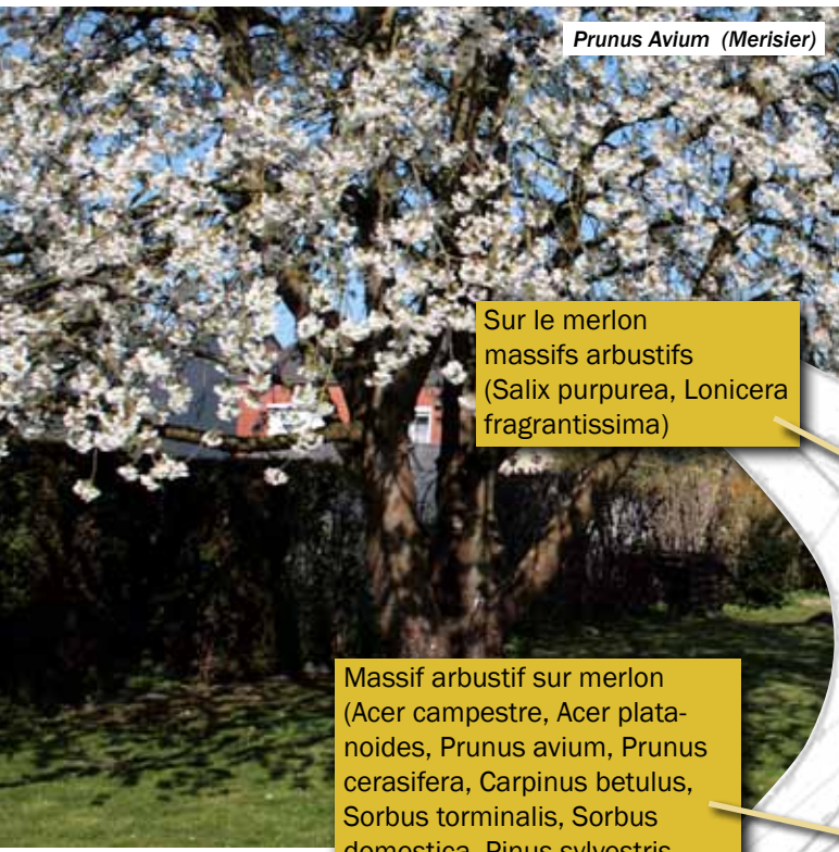
Prunus Avium (Merisier)

Les nombreux aménagements d'espaces verts du lotissement constituent une part significative du projet. Plus de 25 essences de végétaux différentes seront plantées sur le site. Elles contribueront à la qualité environnementale de cet aménagement et procèdent de la préservation de la biodiversité visée par la commune.